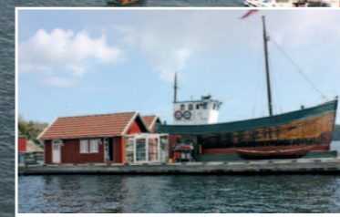
Den utvidede marinaen på Valle.

Hytte & Båtmesse 08.08.09 For mer informasjon se: www.visitvalle.no