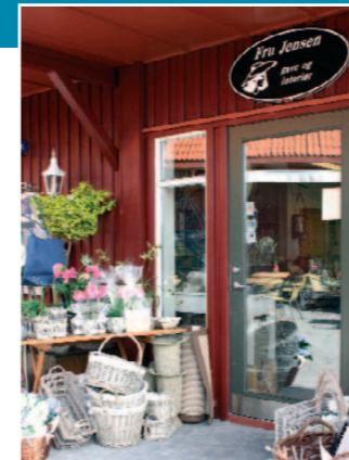
GAVER OG INTERIØR: Hos Fru Jensen kan du handle lekre interiørgjenstander til hytta, eller finne den perfekte gaven til en venn.

smak, men har gjort det på vår egen måte. Burgerne er hjemmelaget, og består hovedsakelig av kvernet indrefilet av okse. Pølsene kommer fra Brubakken i Kragerø, og slik har vi sørget for et lokalt innslag, smiler hun. Fortsatt fins det en egen grillkiosk, for ikke å glemme den legendariske isbaren - som nå har utvidet tilbudet til også å omfatte wienerbrød, kaffe og vaffler.