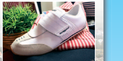
MARITIM MOTE: Hos Sea Fashion finner man det siste innen maritim mote.