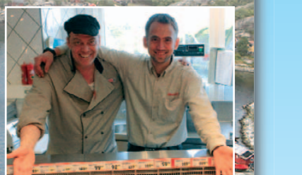
Den utvidede SPAR-butikken kan friste med en ferskvareavdeling som bugner av delikatesser fra så vel over som under havets overflate.